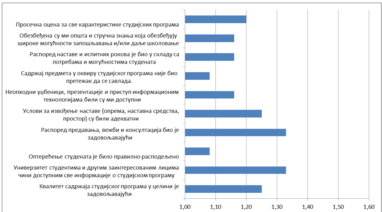
Графикон 1. Оцене квалитета студијских програма на ДУНП.